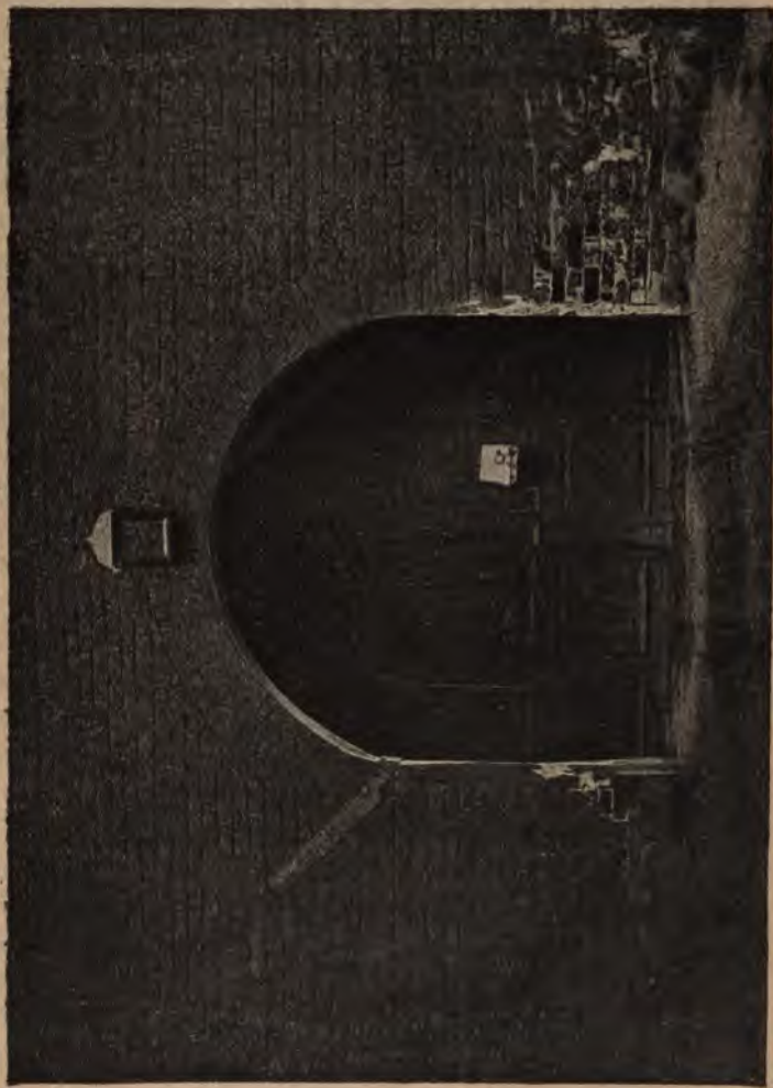
Ворога, вєдушїя вѣ „Суздальскую крѣпость“.